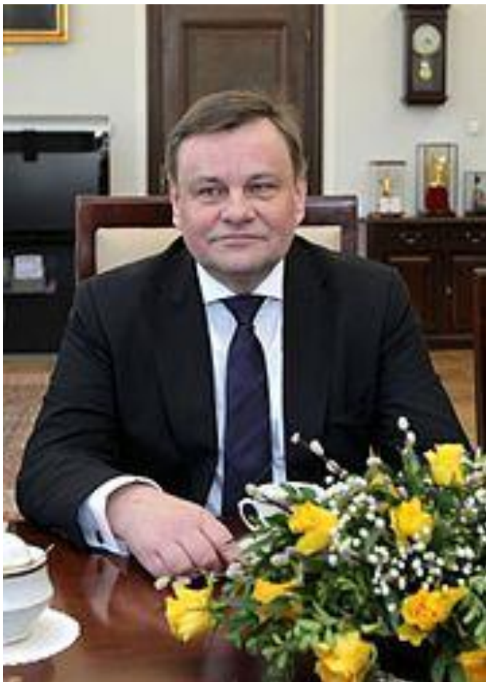
Vydas Gedvilas – Seimo pirmininkas.